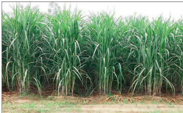
हरिभूमि न्यूज ►► कवर्धा

जिले में गन्ने की खेती इन दिनों संक्रमण काल से गुजर रही है। एक ओर जहां देश में सबसे अधिक कीमत करीब 540 रुपए प्रति विन्टल की दर से कवर्धा जिले के