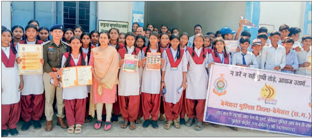
बेमेतरा